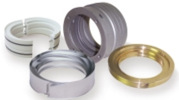
SpiralTrac™-teknologiaa käytetään sekä mekaanisten tiivisteiden että punostiivisteiden kanssa kiintoaineiden ja tiivistepestään jääneen ilman poistamiseen pyörivissä laitteissa. SpiralTrac™-pohjarenkaat ovat saatavissa monenlaisina versioina ja materiaaleina soveltuvuuden optimoimiseksi.