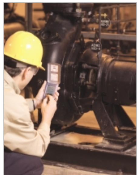
Chestertonin tekninen palvelu kerää tärkeitä laitteita koskevia olennaisia suoritus tietoja, jotka ovat avainasemassa arvosuuntautuneita luotettavuusohjelmia kehitettäessä.