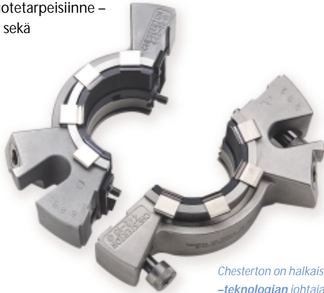
Chesterton on halkaistun Split Seal –teknologian johtaja, jolla on suurin määrä asennettuja kohteita maailmanlaajuisesti.