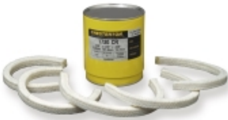
Valmiiksi leikatut tiivistsrenkaat Malli 1730 vähentävät materiaalihukkaa ja yksinkertaistavat asennusta.

Chesterton on globaali johtaja innovatiivisten ja arvosuuntautuneiden tiivistystuotteiden alalla. Yhdessä tietävien asiantuntijoidensa ja teknisen ryhmänsä kanssa Chesterton tarjoaa luotettavia ratkaisuja kaikkiin tiivistystuotetarpeisiin – ratkaisuja, jotka ylittävät vaatimukset toiminnan sekä ympäristö- ja huoltovaatimusten osalta.